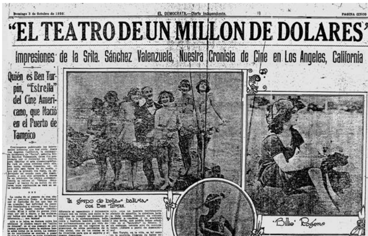
Fragmento de un artículo publicado el 3 de octubre de 1920 en El Demócrata

Una vez más, resignados a que los nombres tan atrayentes no tengan relación en nada con el asunto de las películas, nos concretamos a la figura de [Viola] Dana en “ Casa de Muñecas ” [...] Es esta, seguramente, una de las estrellas que vamos a ver desaparecer del cielo filmico, si no hay un director que rehaga su prestigio. En el argumento de esta cinta se toman muchos recursos de la vida, para hacer así menos perceptible el atraso técnico de la cinta. La chica, mujer sentimental y enamorada del ideal, de un hogar apacible, honrado y moderado en sus gastos, sufre al amoldarse a los caprichos del esposo (Sánchez Valenzuela, 1929, enero 11).