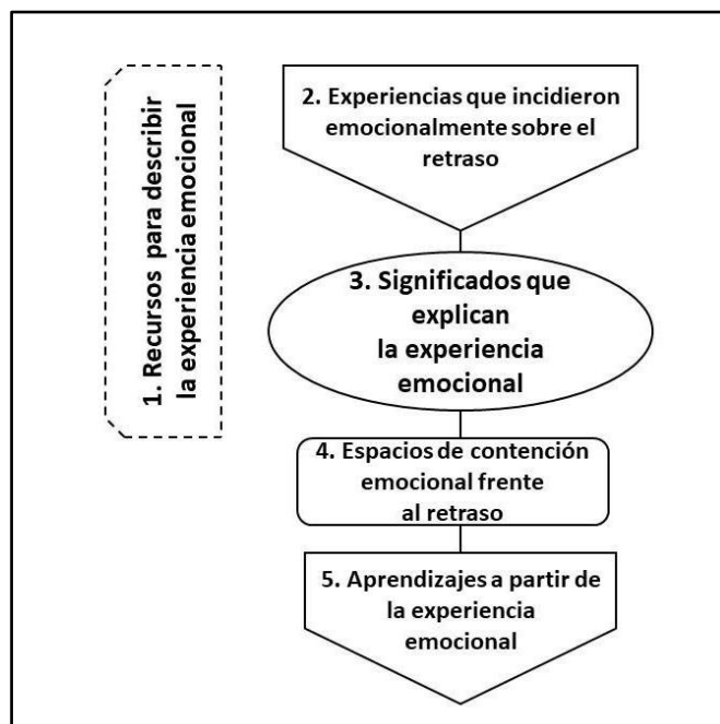
Figura 1 Categorías construidas